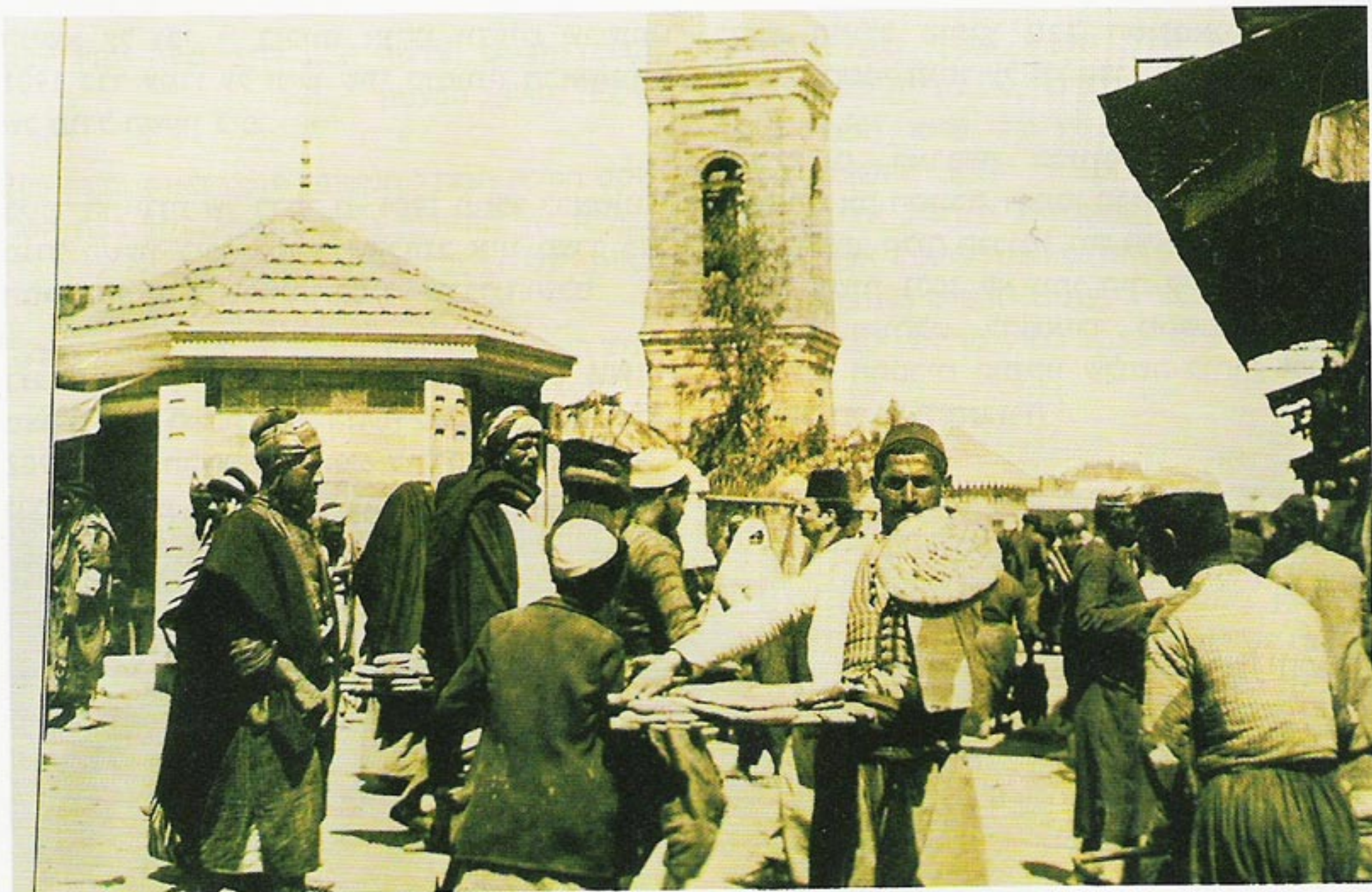
למעלה: תמונה שצולמה על יד הצליין דיויד ל. אלמנדורף בשנת 1901: "מוכר הפיתות בכיכר השוק". ברקע נראה מגדל השעון בן שתי קומות בלבד.

כעבור שבוע, ב-4 באוקטובר 1900, פורסם באותו עיתון: "ביום השבת ז' אלול (תר"ס, י.ל.) הוחג בארצנו חג יום מלאת חמש ועשרים שנה לעלות הדר השולטן על כסא מלכותו... ביפו התפללו ביום זה בכל בתי התפילה אשר לבני הדתות השונות... בבוקר הונח אבן היסוד למגדל שעון העיר הנבנה על הוצאות העיר, במעמד כבוד הקאימקאם וכל גדולי פקידי הממשלה וצירי ראשי הדתות השונות וגם הרב ממלא מקום החכם באשי היה בעת הנחת אבן היסוד..."