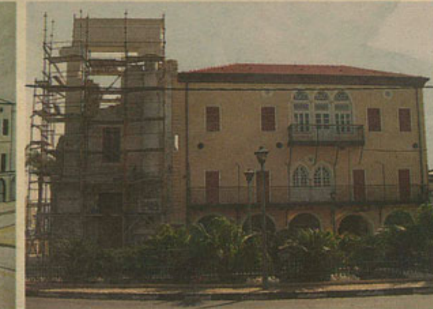
בניין הסראיה לדורותיו. בבניון השעון: תכנית השיחזור, לפני השיפוץ, בסוף המאה ה-19 והיום

המיד השני. אגדה משפחתית מספרת כי את בניית המגדל יוסף ביי מויאל, מעשירי היהודים ביפו.