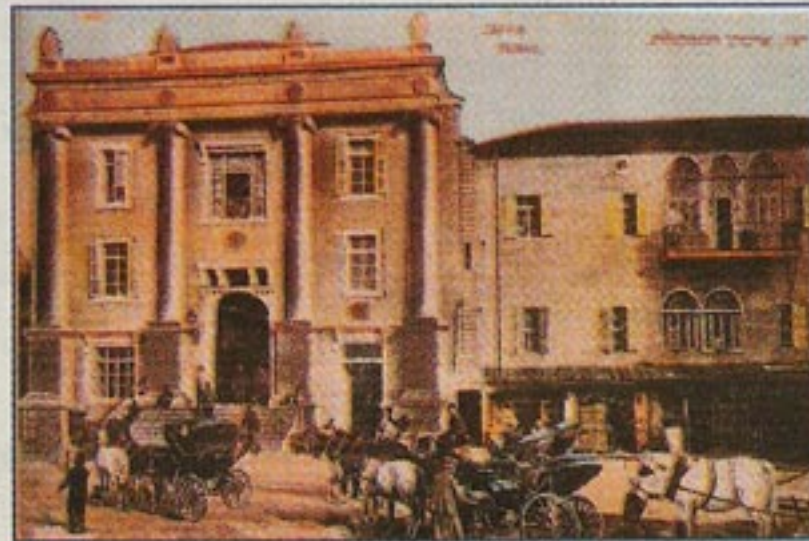
לאחר השיפוץ ישמש כמבנה ציבורי. בניין הסראיה בסוף המאה ה-19

"כנראה למבנה ציבור כמו תיאטרון, גלריה, מתנ"ס או מרכז מבקרים".