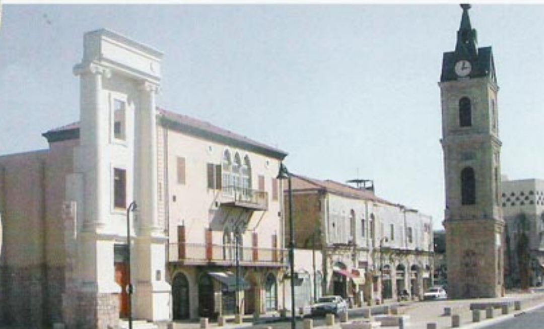
כיכר השעון ביפו. משמאל - "הסראיה" לפני ואחרי שימור